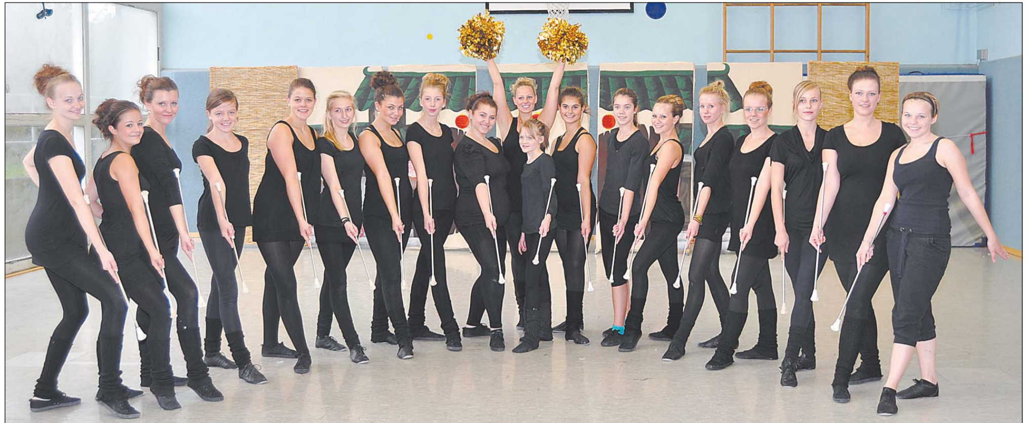
Mit insgesamt 20 Mädchen werden die Chili Kitten an der Deutschen Meisterschaft in Berlin teilnehmen. Die amtierenden Vizemeister haben monatelang dafür trainiert.